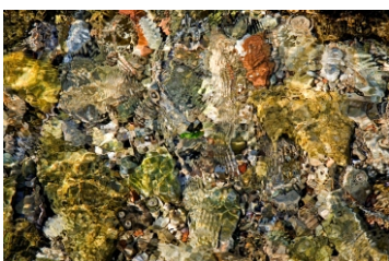
Kataloški broj 297