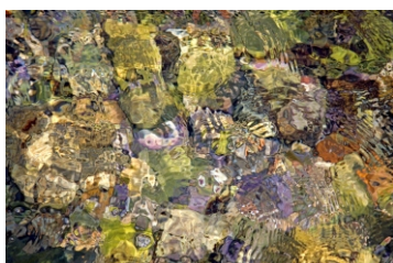
Kataloški broj 117