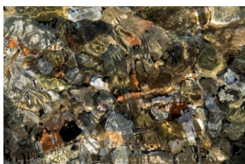
Kataloški broj 267

2005. CROART PHOTO CLUB ZAGREB, 2006. HOTEL NEPTUN BRIJUNI, 2007. GALERIJA »ALT WIEN« GRAZ, 2007. ZLATI AJNGEL VARAŽDIN