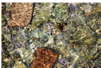
Kataloški broj 150