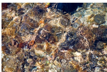
Kataloški broj 189