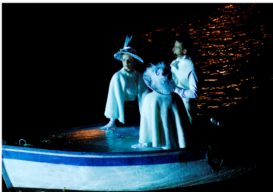
Rainer Maria Rilke