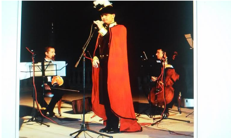
Iz predstava Mittel Europe Ensemble Manuel od Granade