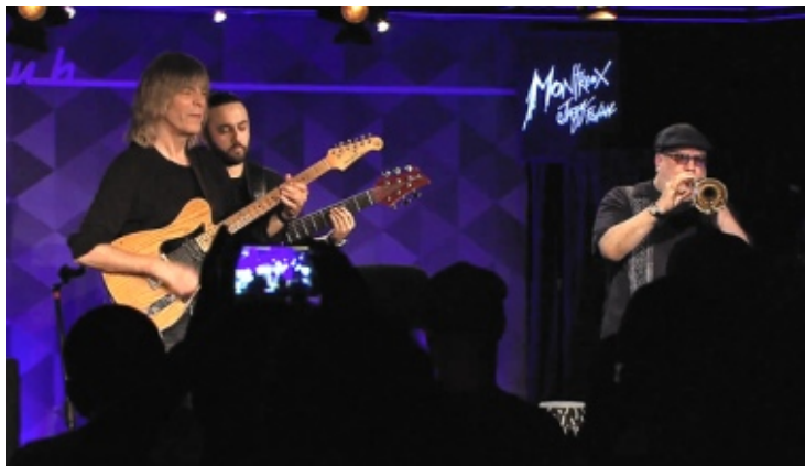
Mike Stern & Randy Brecker

najpoznatijih predstavnika fusiona koji kombinira rock i blues sa sofisticiranim jazz harmonijama. Nekoliko puta je bio proglašen Najboljim jazz gitaristom godine raznih glazbenih časopisa i šest puta nominiran za nagradu Grammy.