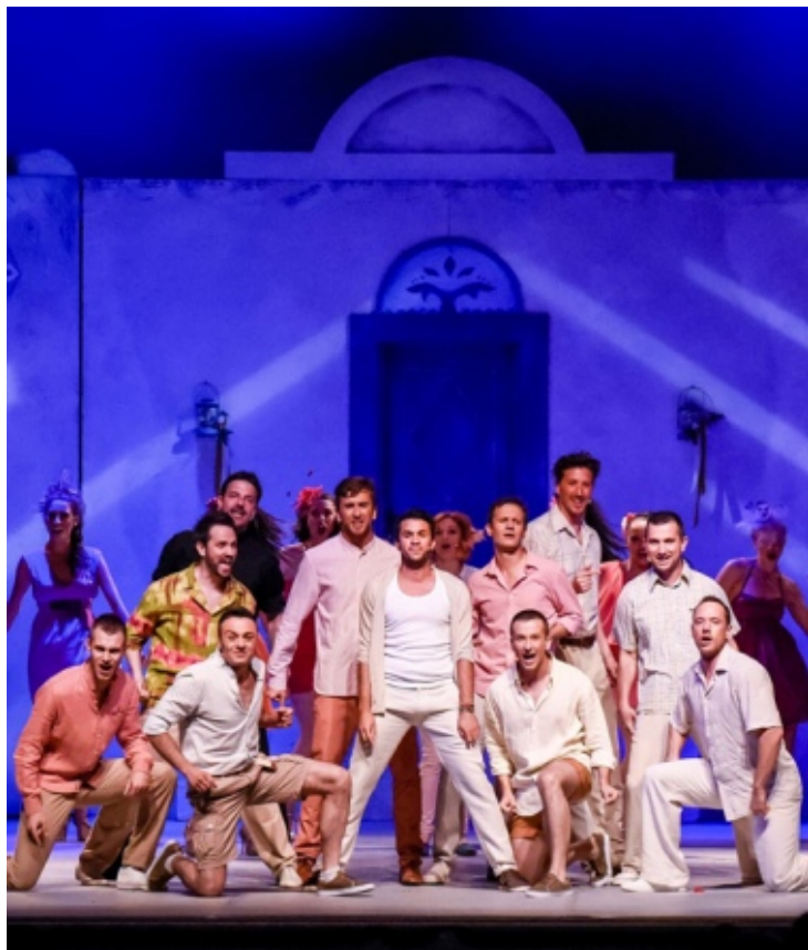
Mjuzikl 'Mamma Mia!', Zagrebačko gradsko kazalište Komedija