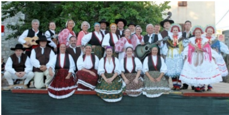
Folklorni ansambl Zora