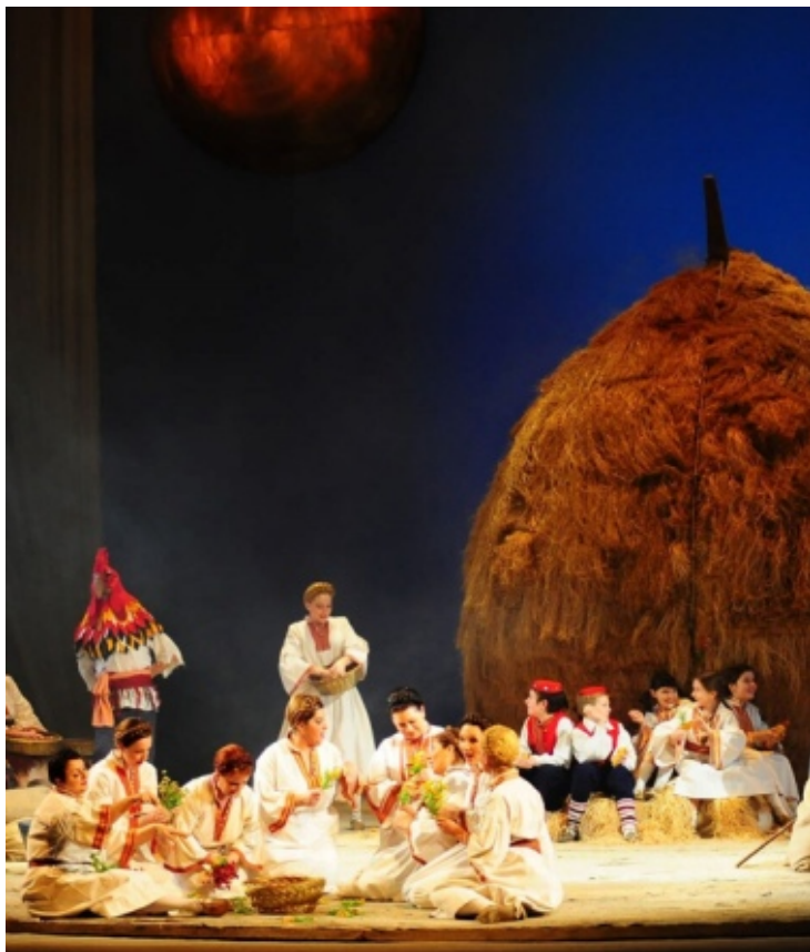
Opera 'Ero s onoga svijeta', Hrvatsko narodno kazalište u Zagrebu