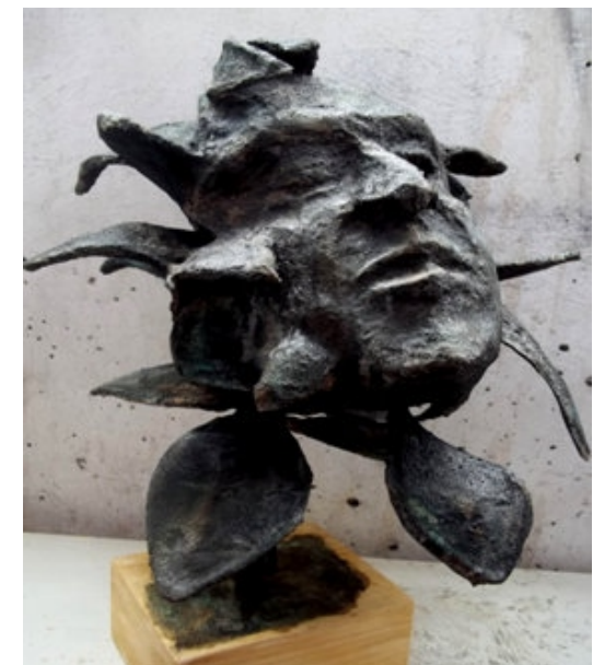
ČUVAR KUĆA - PORTRET FIORELLA LA GUARDIJE, 2012., skulptura, kombinirana tehnika 400x280x280 mm