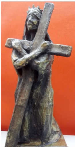
SVETA JELENA KRIŽARICA, 2012., skulptura, kombinirana tehnika 380x160x190 mm